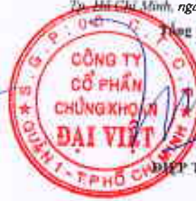
ĐIỆP TRÍ MINH