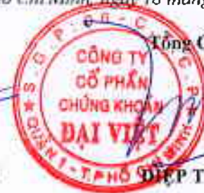
ĐIỆP TRÍ MINH