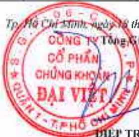
ĐIỆP TRÍ MINH